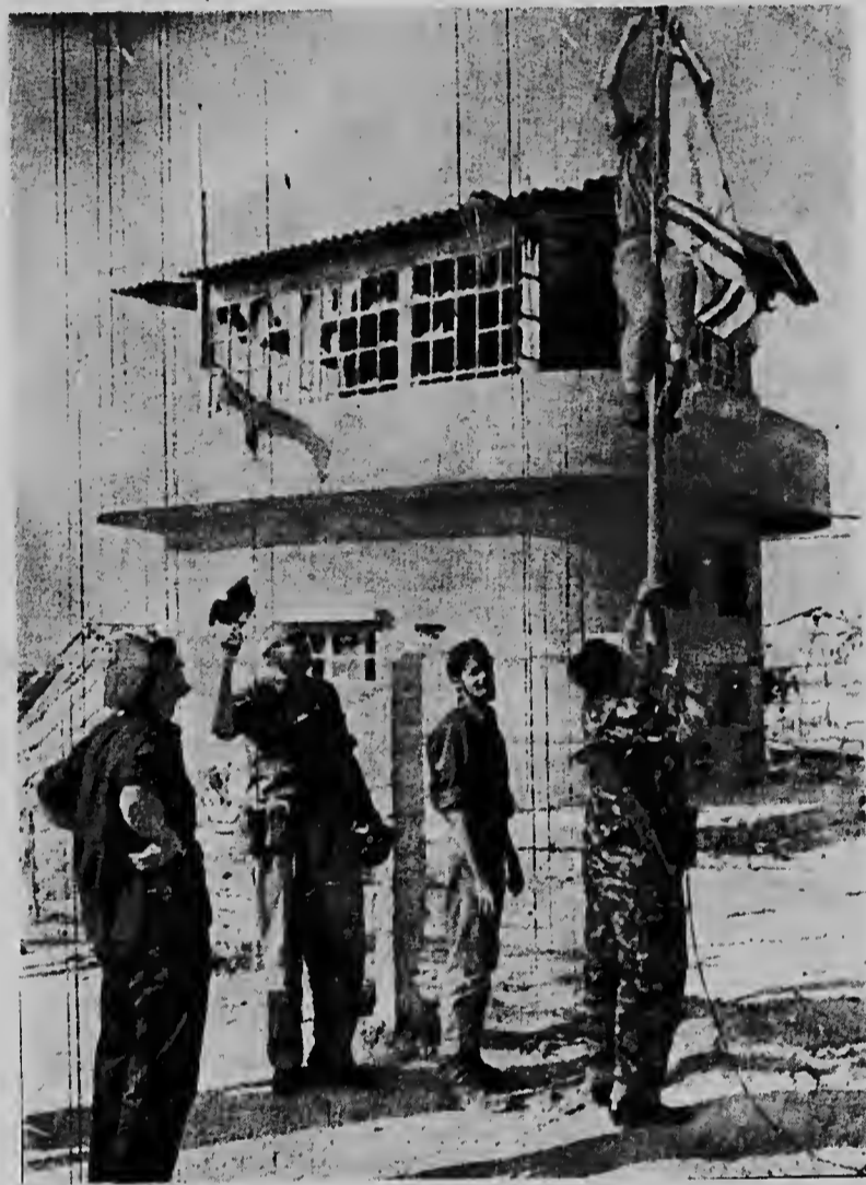
Soldanan Israelie jubilosamente ta hisa nan bandera riba un aeropuerto cu nan a ocupa ayera na El Arish. E hodieunwan a ocupa e aeropuerto topando cu poco resistencia Egipcio.